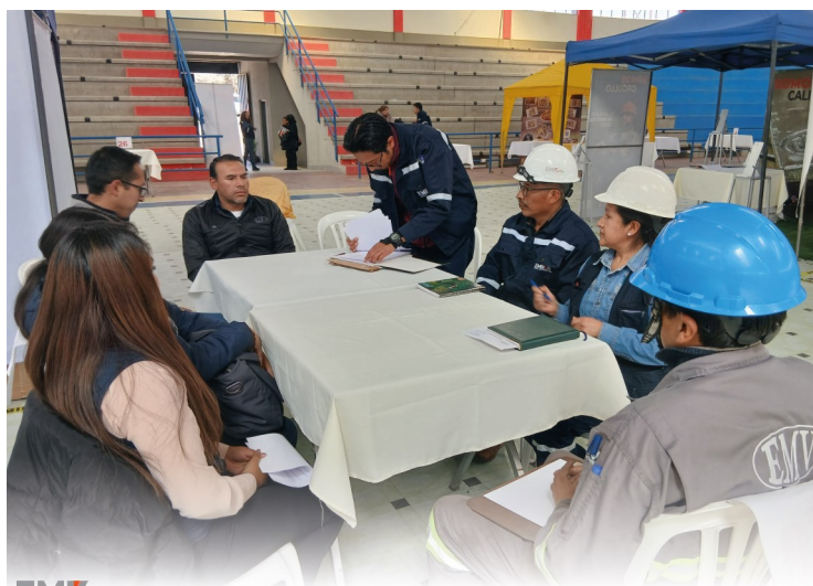
Mesas de negociación