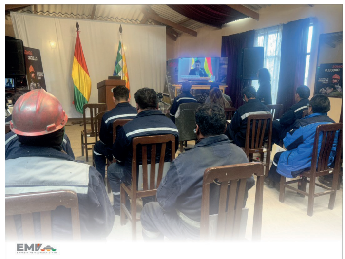
Trabajadores de la EMV participan de la Audiencia de Rendición de Cuentas Final 2024