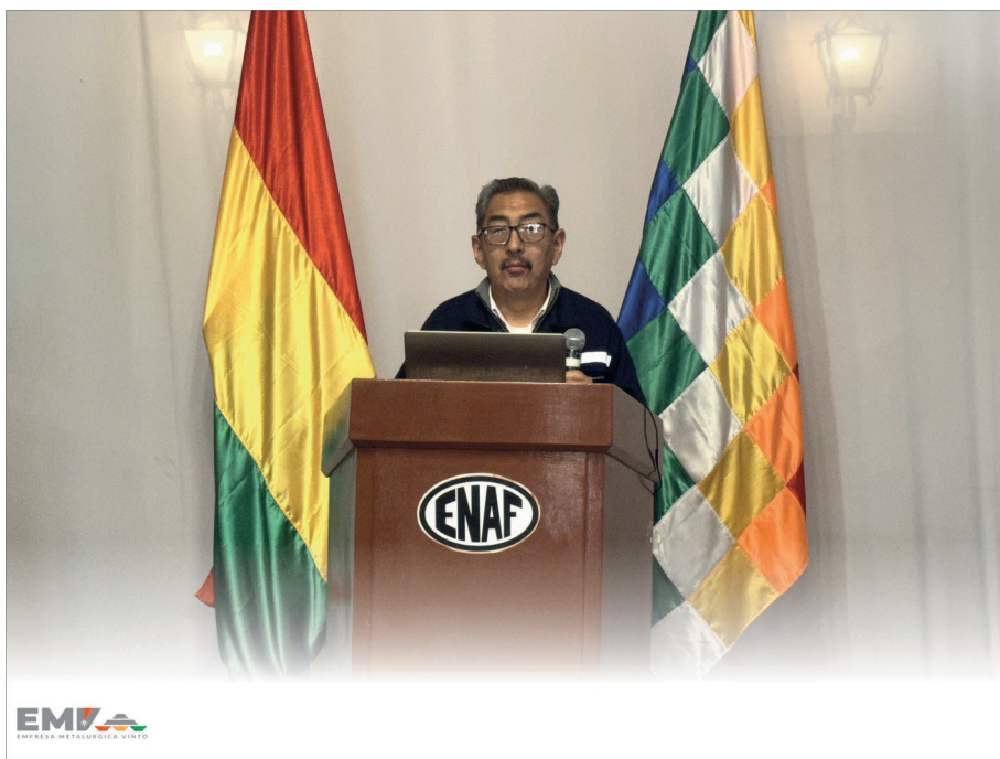
Cerente General de la Empresa a minutos de su presentación

Esta unidad productiva favorecerá al incremento de la producción de estaño metálico en lingotes y en la generación de divisas para el Estado Plurinacional del Bolivia.