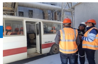
Identificación del primer punto de monitoreo de fuentes fijas, chimenea Baja Ley.