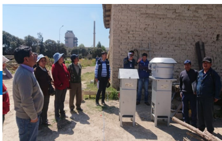
Inspección de los equipos de calidad de aire por las partes interesadas, juntas vecinales y autoridades