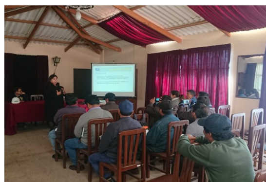
Presentación de la Empresa TECAP –La Cabaña EMV