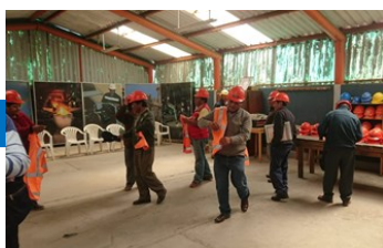
Dotación de EPP's para el ingreso a Planta.