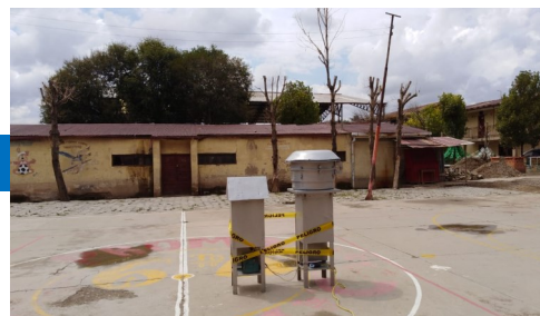
Monitoreo en predios de Colegio Bolivia de Vinto

De acuerdo a la normativa ambiental vigente, los resultados obtenidos en el monitoreo serán enviados por la EMV a la autoridad ambiental competente en el IMA anual de la gestión en curso.