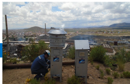
Instalación de equipos de monitoreo de calidad de aire