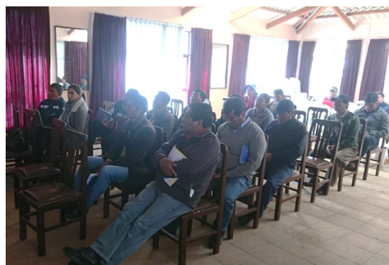
Juntas vecinales de Vinto en la reunión de inicio realizada en La Cabaña– EMV

Luego de la presentación realizada por el TECAP, la Unidad de Medio Ambiente de la EMV en presencia de los grupos de interés: Juntas Vecinales de la población de Vinto e instancias competentes de la Gobernación y el Municipio, procedió a la instalación de los puntos de monitoreo, previstos en su Programa para la gestión 2019.