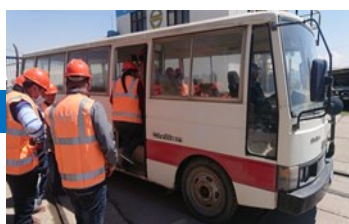
Ingreso a Planta guiados por los responsables del área.