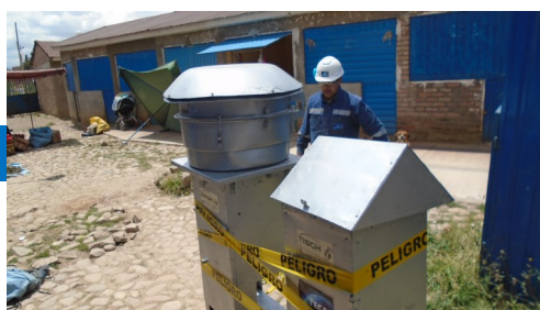
Monitoreo en Mercado de Zona Satélite

Desde fines de la gestión 2018 y atendiendo recomendaciones de la autoridad competente, el Programa de Monitoreos de la presente gestión, incluye 2 nuevos puntos de monitoreo de calidad de aire, localizados en el Mercado de la Zona Satélite y el Colegio Bolivia de Vinto.