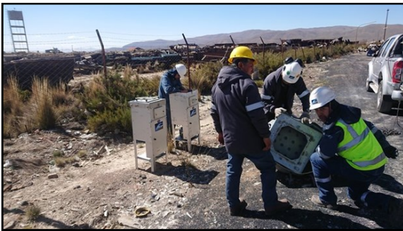
Sector Depósito de Chatarra