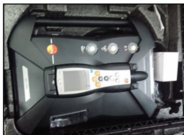
Equipo de monitoreo de gases