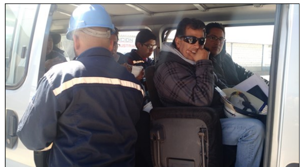
Ingreso a Planta, técnicos del Municipio y del MMAA

Concluida la presentación, todos los asistentes ingresaron a Planta para verificar la disposición del equipo de monitoreo en puntos de control previamente establecidos por la EMV .