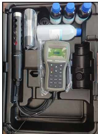
Equipo multiparámetro para control de agua