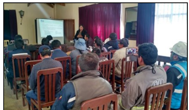
Presentación del TECAP antes del inicio del monitoreo

ción (DTA) del Instituto Boliviano de Metrología (IBMETRO) que realizó una presentación para explicar su desarrollo, duración y método aplicado de acuerdo a lo establecido en la Ley 1333 y sus reglamentos .