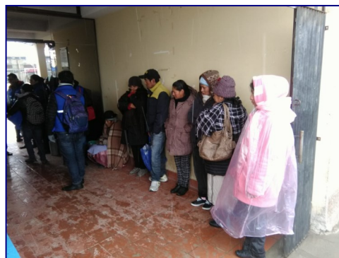
Ministro de Salud , Dr. Rodolfo Rocabado se hizo presente en los ambientes del Colegio Bolivia Vinto donde se realizó la Feria de Salud.