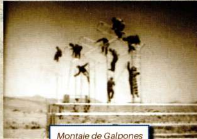
Montaje de Galpones