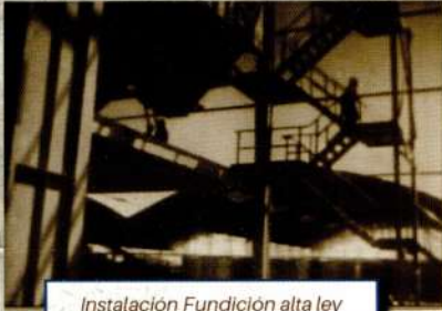
Instalación Fundición alta ley

Los hornos de fundición se instalan entre el año 1966 a 1970 y es el 9 de enero del año 1971, en la presidencia del Gral. Juan Jose Torrez Gonzales, que ENAF inicia operaciones con la puesta en marcha de la Fundición de Alta Ley .