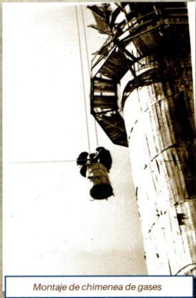
Montaje de chimenea de gases