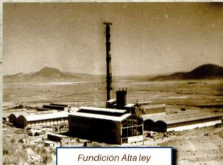
Fundición Alta ley