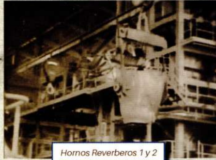
Hornos Reverberos 1 y 2