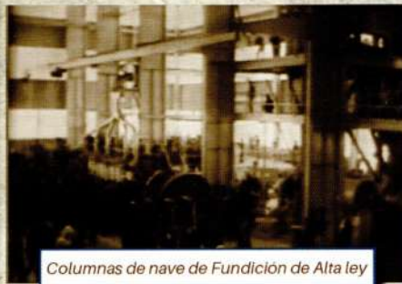
Columnas de nave de Fundición de Alta ley